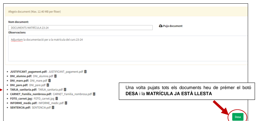
FOTO DE CARNET Enviau-la en format JPG No s'admetrà cap fotografia enviada en format PDF